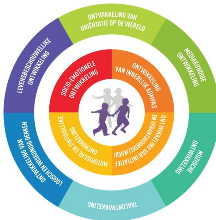
De binnen -en buitencirkel met ontwikkelvelden.

De harmonische ontwikkeling van de totale persoon komt tot uiting in de grafische voorstelling van het ordeningskader met een binnen- en een buitencirkel. In de binnencirkel plaatsen we de persoonsgebonden ontwikkeling. In de buitencirkel situeren we de cultuurgebonden ontwikkeling. Tussen de ontwikkelvelden is er, over die cirkels heen, een voortdurende interactie. Alle ontwikkelvelden beïnvloeden elkaar en hebben elkaar nodig.